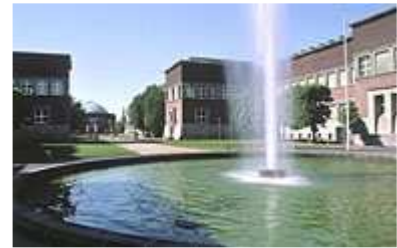
Museenzentrum am Ehrenhof