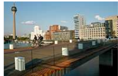
Die neue Fußgängerbrücke im MedienHafen