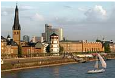
Rheinfront Altstadt bei Tag