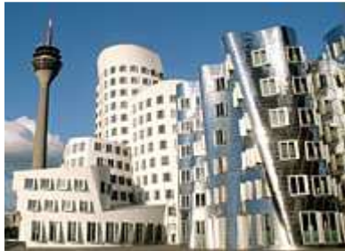
Die Gehry-Bauten im MedienHafen, im Hintergrund der Rheinturm