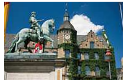
Jan Wellem-Standbild vor dem Rathaus in der Altstadt